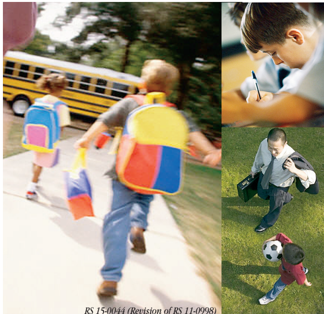
RS 15-0044 (Revision of RS 11-0998)